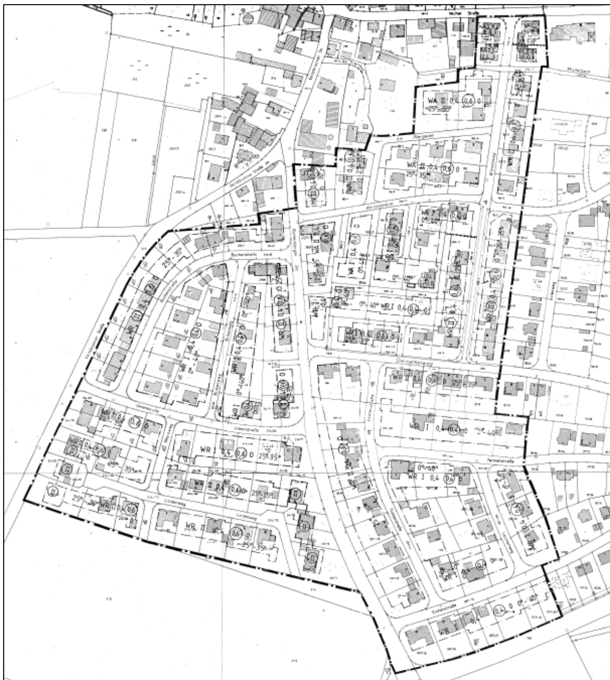
Abbildung 3: Planzeichnung des BP „Obermichelbach Süd Teil 1“ (Fassung von 1999), in rot umrandet: Geltungsbereich der 6. Änderung des BP