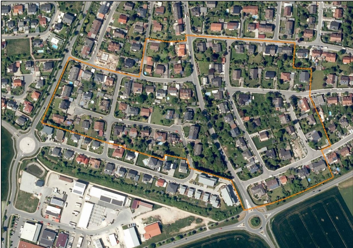
Abbildung 1: Orthophoto (Befliegung vom 01.06. 2021) mit Abgrenzung des Geltungsbereichs (orange gestrichelt umrandet) der 6. Änderung des Bebauungsplans „Obermichelbach Süd Teil 1“ der Gemeinde Obermichelbach

Der Gemeinderat der Gemeinde Obermichelbach hat in seiner Sitzung am 27.07.2022 beschlossen den Bebauungsplanes Nr. 1 „Obermichelbach Süd Teil 1“ in einem Teilbereich zu ändern. Es handelt sich um die 6. Änderung des Bebauungsplanes (BP), dessen Geltungsbereich im Süden des Hauptortes der Gemeinde Obermichelbach liegt und bis auf einzelne Grundstücke bereits überwiegend mit einer lockeren Einzel- und Doppelhausbebauung bebaut ist (siehe Abbildung 1). Der Geltungsbereich der 6. Änderung des BP Nr. 1 ist umgeben von Wohnbebauung. Im Süden grenzt der Geltungsbereich zudem teilweise an die Kreisstraße FÜ 17, im Westen teilweise an die Veitsbronner Straße an.